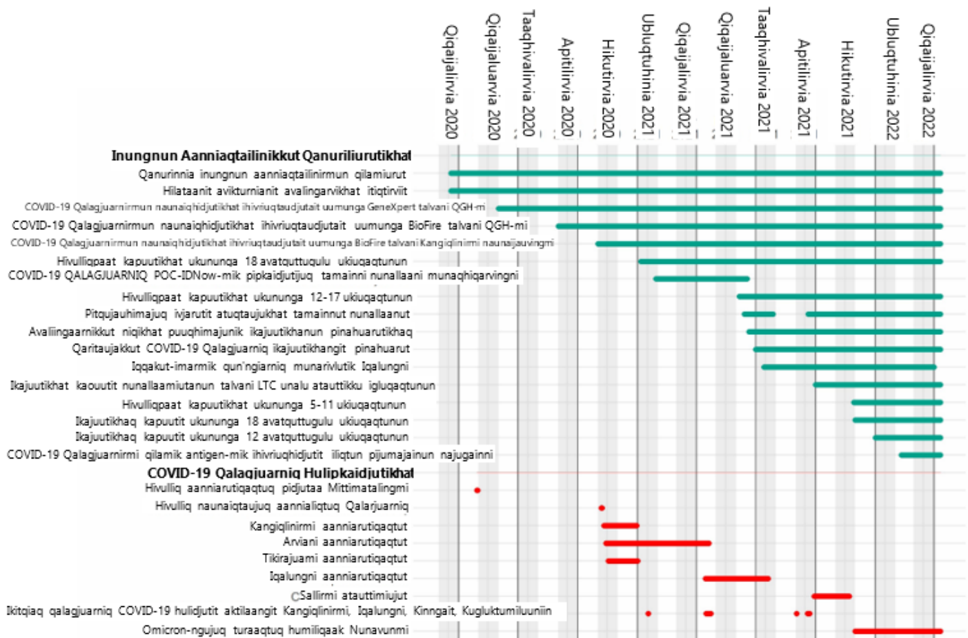
Naunaijaqhimajuq 3: Kiklighait pidjutaaluqaqtut inungnun aanniaqtailinirmun hulidjutit ukualu qalagjuarnirmun COVID-19 hulidjutit Nunavunmi hamanga Qiqailruq 2020 hamunga Qitiqautijuuq 2022.

Inungnun aanniaqtailinirmun hatumiarutit Nunavunmi aanniarutiqaqtilugu nunaqjuami ilaujut ihuaqhijuumiqhimajut hulidjutit ihivriuqhinirmun, aanniarutit hiamitirniranun munaridjutit, kapuutit, ilihaidjutit, ukualu inungnun tuhaqtdjutit. Ilaliutihimajut nunallaap-tamaanun inungnun aanniaqtailinirmun maligahat atuqtilugu inungnun aanniaqtailinirmun qilamiurutit ilaujut kikliqaqtut katimanirmun, iliharviit umiktitaublutik, tingmitailidjutillu (Naunaijaqhimajuq 3).